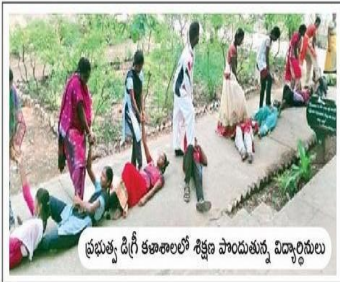
ప్రభుత్వ డిగ్రీ కళాశాలలో శిక్షణ పొందుతున్న విద్యార్థినులు