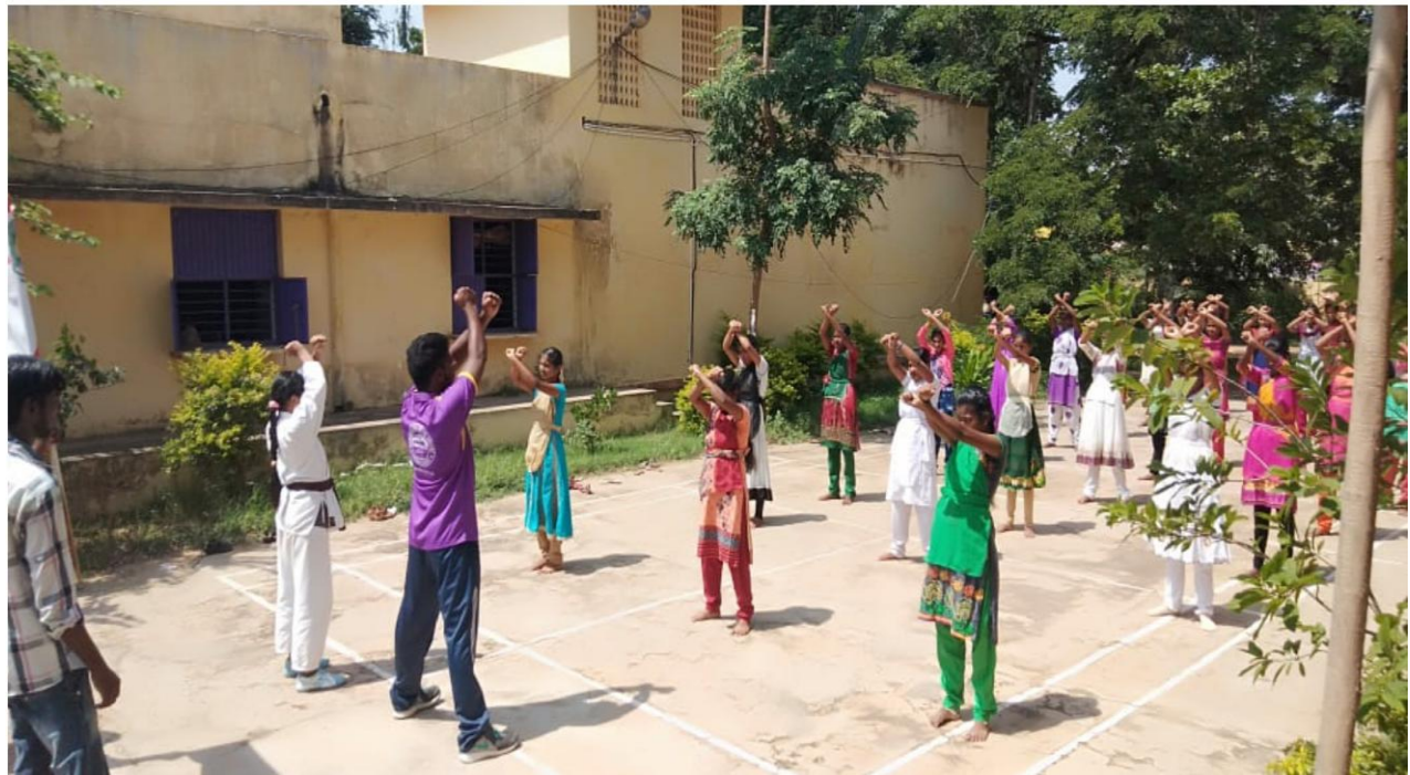
Self defense training session