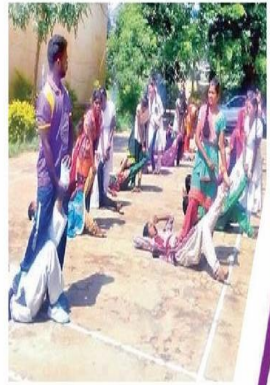
విద్యార్థినులు చేస్తున్న విద్యార్థినులు

స్వీయరక్షణలో శిక్షణ పొందడం విద్యార్థినుల అధ్యక్షం. సమాజంలో జరిగే మటనలను మాస్టరుంటే ఇది చాలా అవసరం అని పేర్కొంది. యువకులంటే అల్లరి చేష్టలు చేసేవారికి భయం ఉండాలి. నిత్య జీవితంలో రాణించేందుకు ఎంతో ఉపయోగపడుతుంది.