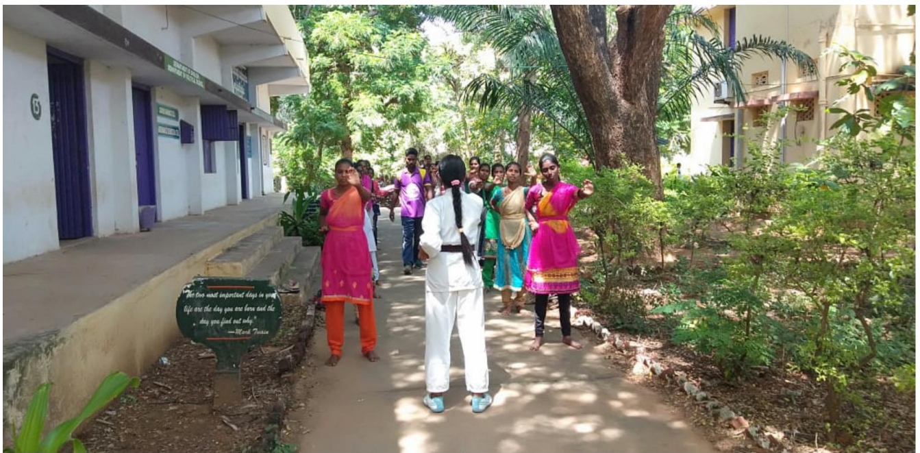
Self defense training session