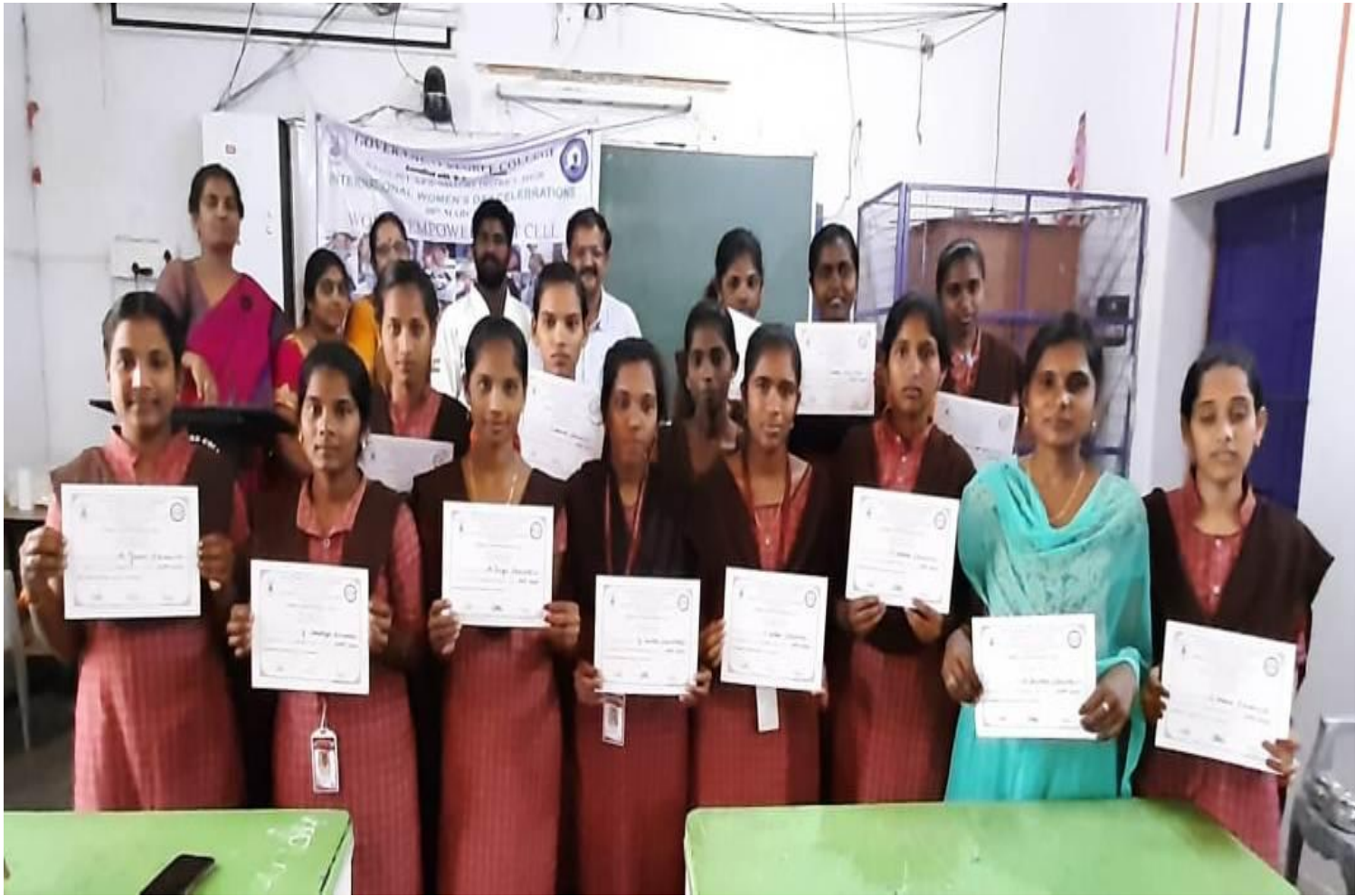
Valedictory function on “Self Defense”