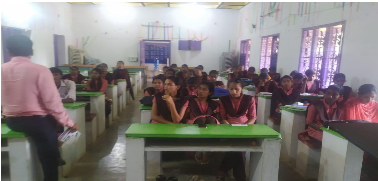
70. Career Counselling on 28-02-2020