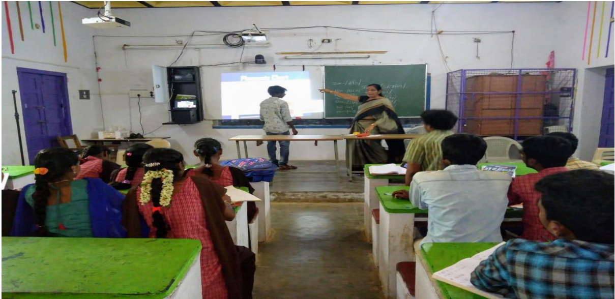
58. MODEL JKC GRAND TEST 04-12-2019