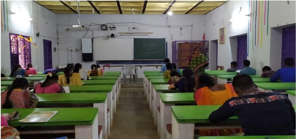
57. ICT CLASS 15-10-2019