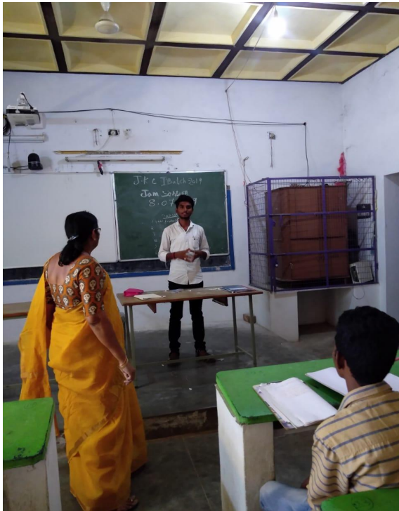
42. JAM Session- 08-07-2019