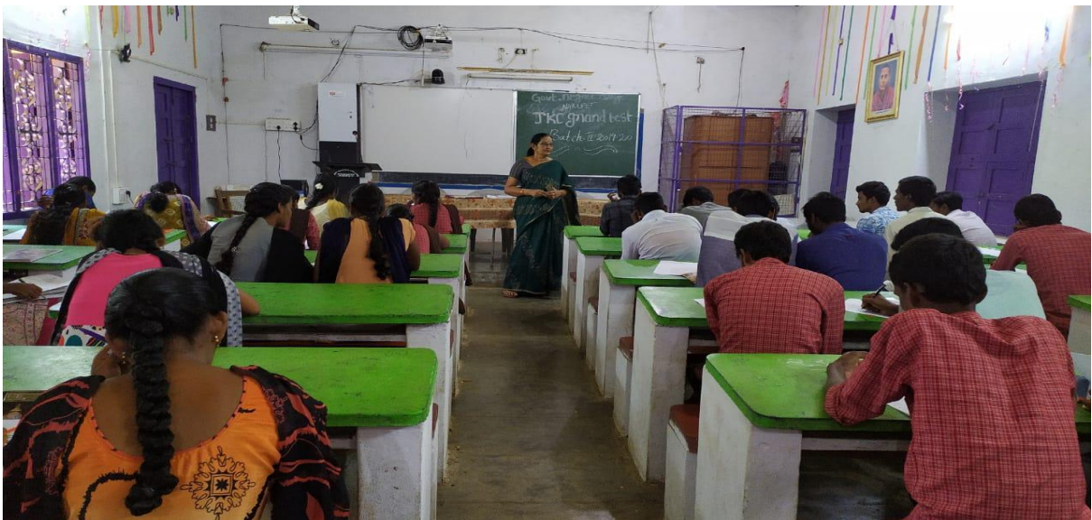
59. Group Discussion