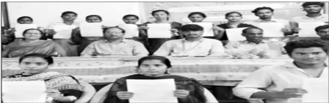
జాబ్ మేళాలో పాల్గొన్న అభ్యర్థులు