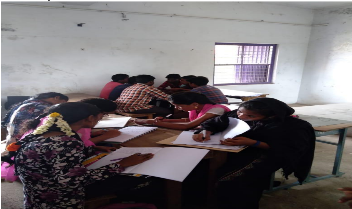
44. JAM Session:09-07-2019