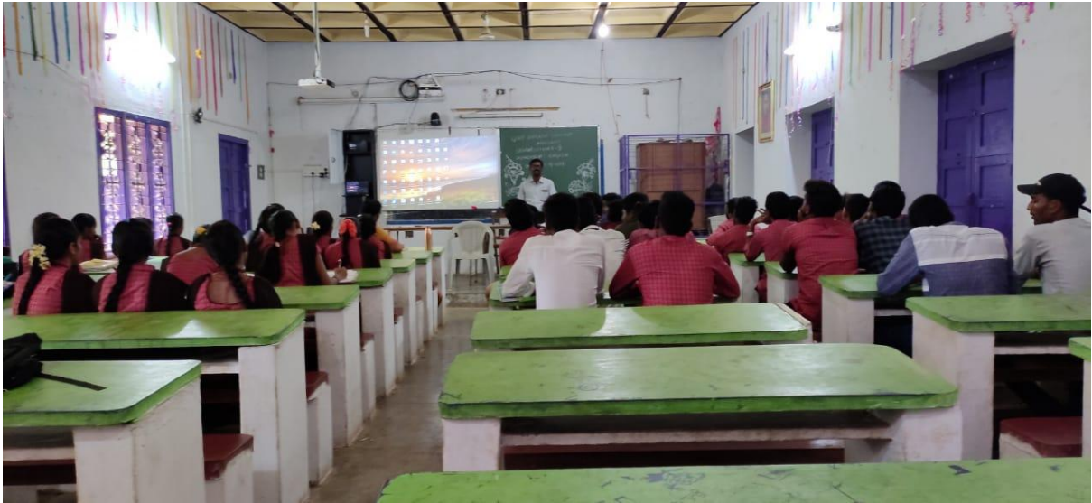
56. MODEL JKC GRAND TEST 31-09-2019