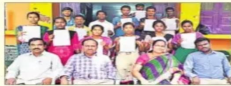
ఉద్యోగాలకు ఎంపికైన విద్యార్థులు