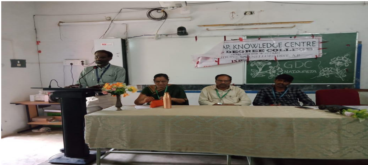
53. Student Seminar 20-09-2019