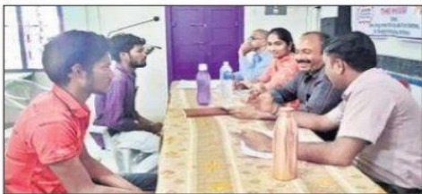
ఇంటర్వ్యూలు నిర్వహిస్తున్న కంపెనీ హెచ్ఆర్ లు