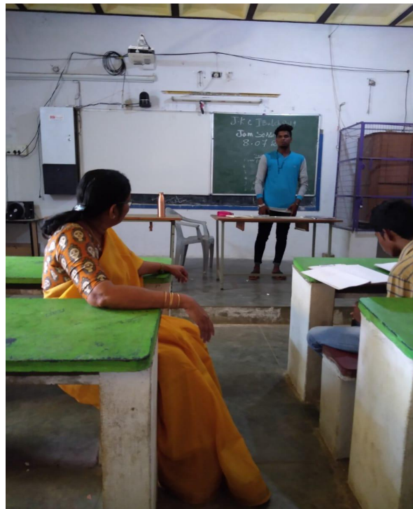
43. Group Work 08-07-2019