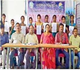
ఉద్యోగాలకు ఎంపికైన విద్యార్థులతో ప్రీన్వీసర్, అధ్యాపకులు

నాయుడు పేట పట్టణం, న్యూనటుడే శ్రీ విజన్ కేంద్రమైన నాయుడుపేటలోని ప్రభుత్వ డిగ్రీ కళాశాలలో ప్రభుత్వం జవహర్ విజ్ఞాన కేంద్రం ఏర్పాటు చేసింది. ఇందులో ఒకవైపు చదువుకొంటూనే మరోవైపు ఉద్యోగాలకు అవసరమైన మెలకువలు నేర్చుకుంటున్నారు. ఈ కేంద్రంలో విద్యార్థులకు మూడేళ్ల పాటు